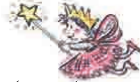
پریوں کی کہانیوں کی کتابیں