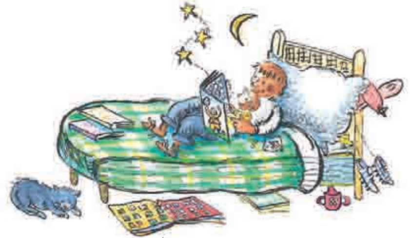
سوتے وقت سننے کی کتابیں