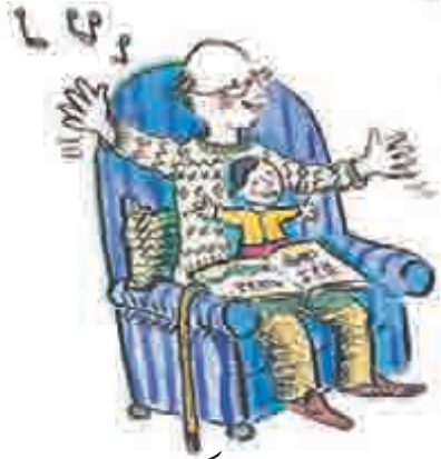
گانوں کی کتابیں