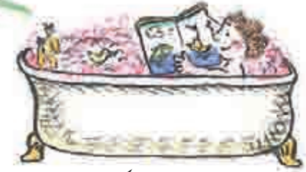
نہانے کے وقت کی کتابیں