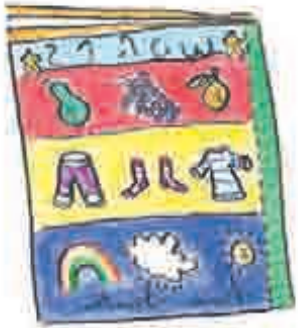
کسی طرح کی بھی کتابیں!